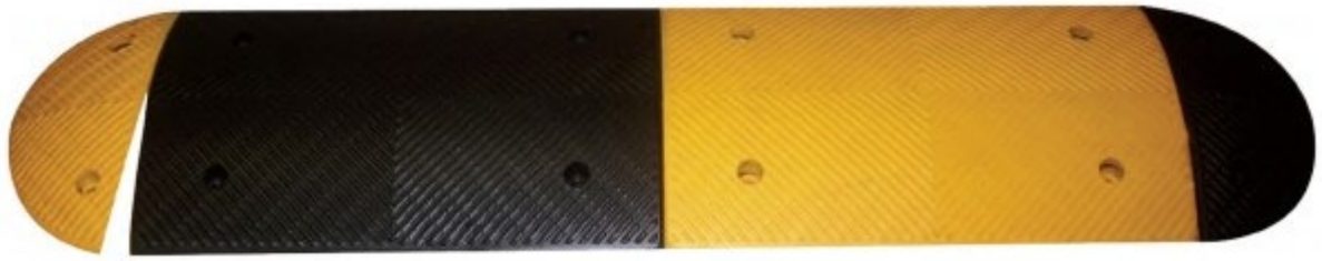
K200 – Limitator de viteza: