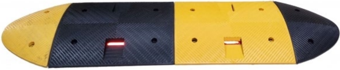
K220 – Limitator de viteza: